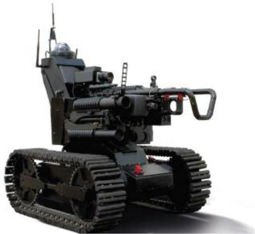
Trp-2: l'Ugcv prodotto dalla Oto Melara. In basso, disegno e misure del Tpr-3. Nella pagina successiva, l'Uuv Knifefish, in grado di comunicare attraverso i satelliti e rilevare volumi sul fondo marino e mine (disegno Bluefin Robotics Corp).

di capacità operative e industriali. In particolare la Oto Melara ha risposto a un requisito operativo urgente per la protezione delle Forward Operating Base (Fob) italiane in Afghanistan attraverso lo sviluppo di un mezzo robotico cingolato, il Trp-2 , che coniuga capacità combat e Reconnaissance Intelligence Surveillance Target Acquisition (Rista). Nella versione combat, il Trp-2 , ha un peso di 100 kg ed è armato con una mitragliatrice Fn Minimi calibro 5,56 mm e un lanciagranate da 40 mm da 6 colpi. In tale configurazione, pilotato a distanza, può effettuare missioni di sorveglianza del perimetro esterno delle basi, individuando, ed eventualmente ingaggiando elementi ostili. Il Trp-2 è disponibile anche in configurazione Rista, alleggerito e sviluppato per venire incontro alle necessità delle forze esploranti dell'Esercito italiano. Oltre al Trp-2 , l'azienda spezzina ha sviluppato anche il più piccolo e discreto Trp-3 , ideale per impieghi di intelligence e per uso urbano. Questo piccolo drone elettrico, pesante 3 kg e lungo 30 cm, è dotato di 6 telecamere, microfono e telemetro laser e può essere impiegato con grande facilità da un singolo operatore per effettuare ricognizioni estremamente discrete in contesti complessi quali edifici, sotterranei, tubature ecc.