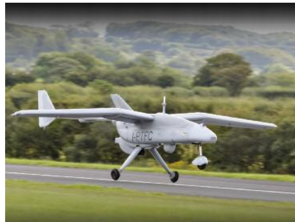
Falco, aeromobile a pilotaggio remoto progettato e costruito dalla Selex ES (Leonardo). Nel gennaio 2007 Galileo Avionica ha completato le prove in fabbrica e cominciato la consegna dei primi esemplari al cliente di lancio, il Pakistan.

Nel 2007 la famiglia Heron si è allargata a una seconda versione più strategica, chiamata Heron Tp (ma anche Eitan ) che si caratterizza per un peso massimo incrementato a 4.650 kg e la capacità di effettuare missioni Istar e strike a distanze vicine ai 4.000 km. Infine, nel febbraio 2014, al Singapore Air Show è stato mostrato il nuovo Super Heron , una versione intermedia tra lo Shoval e l' Eitan . Questo velivolo utilizza un motore diesel da 200hp di derivazione Fiat (adattato all'impiego aeronautico dall'italiana DiesellJet) al fine di garantire maggior sicurezza e costi di gestione più contenuti. Ovviamente, la famiglia Heron è