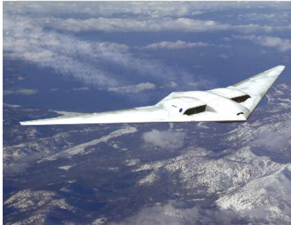
Sopra, Rq-170 Sentinel; sotto, un X-47B rifornito da un Omega K-707.