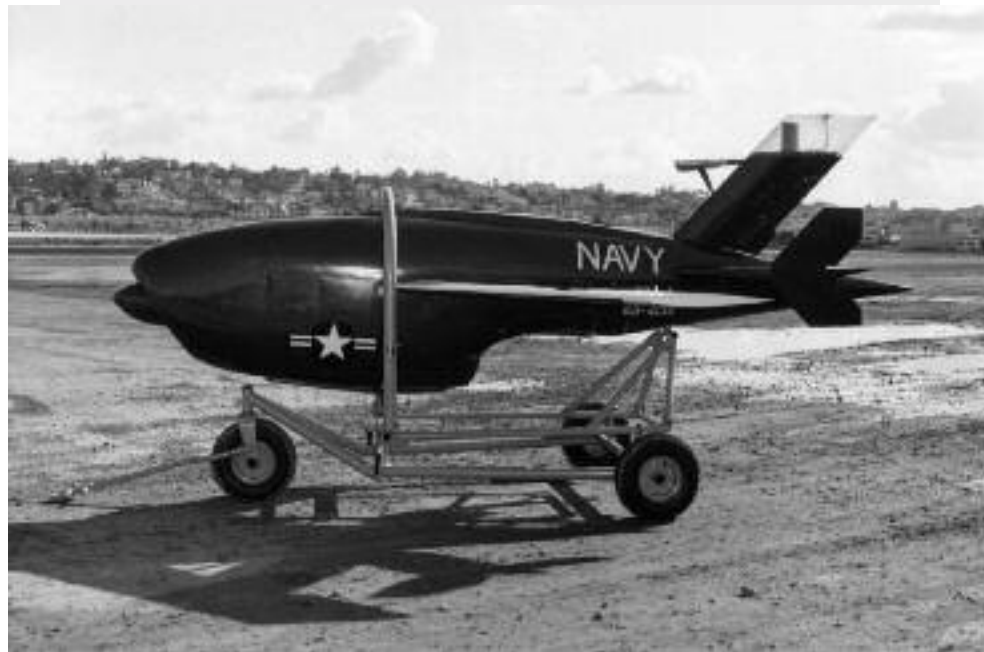
Nella pagina successiva, dall'alto: assemblaggio del Ryan Firebee; il Firebee è montato sotto l'ala di un Usaf A-26 Invader.

I primi esperimenti in ambito aeronautico per la remotizzazione di velivoli a fini bellici risalgono al periodo tra le due guerre mondiali ma, fino agli anni Sessanta, i prototipi realizzati furono utilizzati come aereobersagli addestrativi. In seguito, il primo drone da ricognizione fu impiegato dall'U.S. Air Force (Usaf) durante la guerra del Vietnam. A partire dagli anni Cinquanta, l'Aeronautica americana aveva iniziato a intuire le potenzialità degli aereobersagli Q-2 (noti come Firebee e prodotti dalla Ryan Aeronautical Company) che, grazie alle doti di maneggevolezza e velocità, si sarebbero potuti prestare a utilizzi differenti rispetto a quelli per i quali erano stati progettati. A partire dal 1958 furono avviati gli studi per convertire l'aereobersaglio Q-2C in un velivolo da ricognizione. In particolare, l'ala e la struttura del velivolo furono ingrandite per contenere un motore più potente e un serbatoio di maggiori dimensioni in grado di garantire un'autonomia di circa 2.000 miglia – a 60.000 piedi di quota – a una velocità di crociera di poco inferiore a quella del suono. Inoltre, al fine di aumentarne la capacità di sopravvivenza in spazi aerei particolarmente controllati come quello sovietico, furono individuati degli accorgimenti per ridurre la segnatura radar del velivolo attraverso l'uso di vernici radar-assorbenti. Nonostante la lungimiranza del piano sviluppato dalla Ryan Aeronautical Company e l'interesse dell'Usaf, il