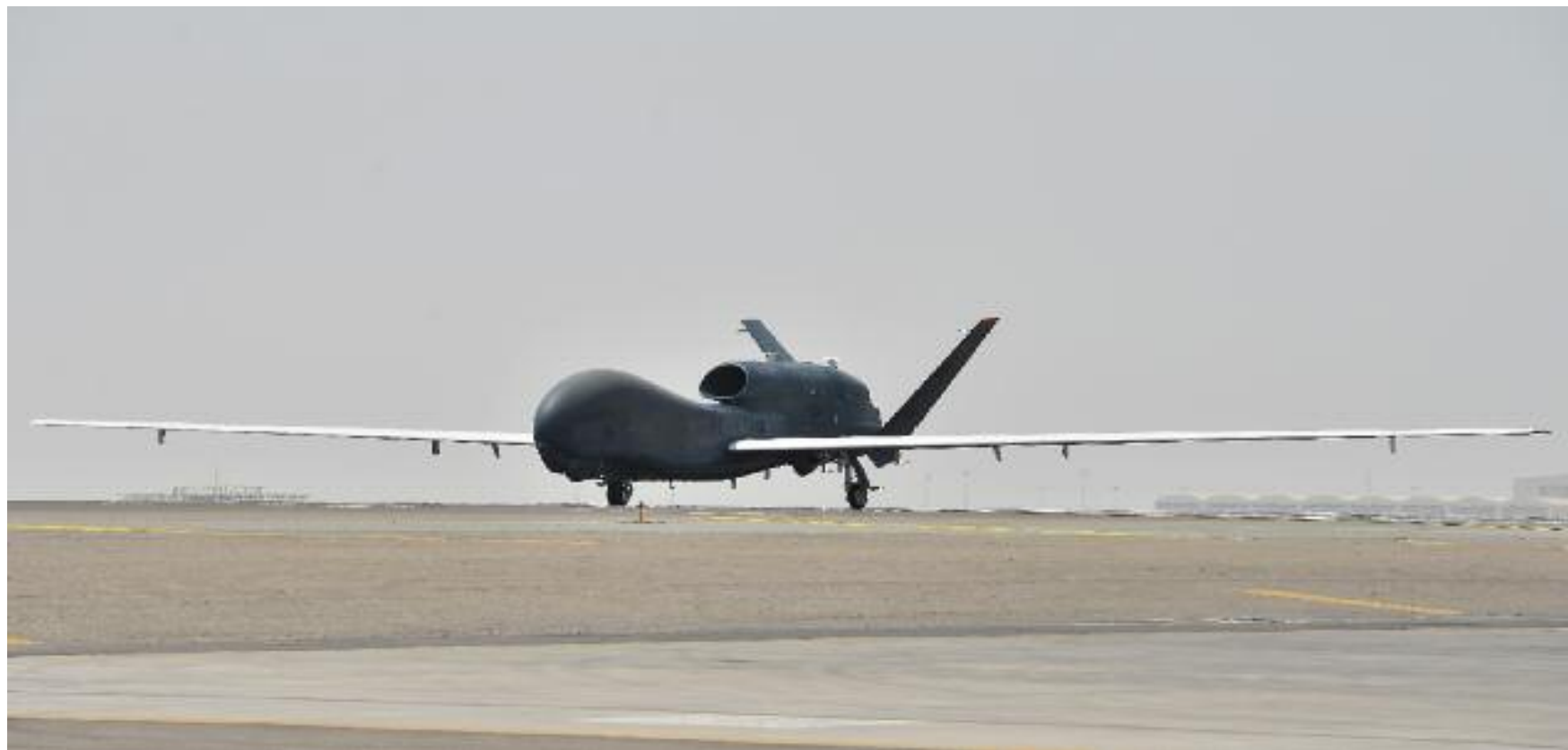
Un Rq-4 Global Hawk in attesa di ispezione sulla pista di decollo. Nella pagina precedente, U-2 Dragon Lady.

Il cuore del sistema di osservazione trasportato dal Global Hawk è rappresentato dal Synthetic Aperture Radar (Sar) per osservazione terrestre, denominato Multi-Platform Radar Technology Insertion Program (Mp-Rtip) – realizzato dall'azienda americana Raytheon – che abbinata due funzioni complementari: da un lato, il Ground Moving Target Indicator radar (Gmti) monitora il movimento di veicoli nell'area di interesse, indipendentemente dalle condizioni atmosferiche, tracciandone rotta e caratteristiche di movimento; dall'altro, il sensore Sar fornisce immagini radar con una risoluzione fino a 1,8 m. L'insieme dei sensori è ulteriormente completato da rilevatori all'infrarosso, sensori elettro-ottici e sistemi di elaborazione e trasmissione delle immagini alle stazioni a terra. Così come il Predator/Reaper, anche il Global Hawk può ospitare diverse tipologie di sensori e, a fianco della configurazione tradizionale, sono possibili varianti Sigint (come quella selezionata a suo tempo dalla Germania per il fallito programma Eurohawk) e per la sorveglianza marittima (Mq-4C Triton della U.S. Navy). Inoltre, il Global Hawk sarà l'elemento portante del programma Alliance Ground Surveillance (Ags) della Nato che prevede lo schieramento di 5 velivoli e relative strutture di gestione e supporto nella base di Sigonella entro il 2017.