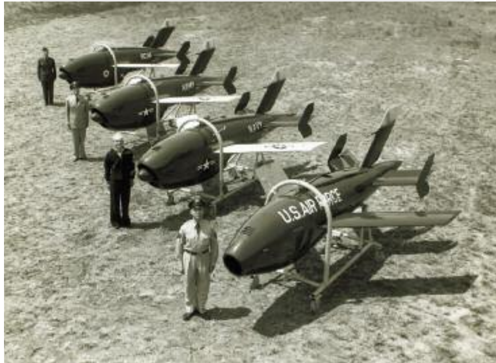
Foto pubblicitaria con i primi piloti del Ryan Firebee: United States Air Force, United States Navy, United States Army and Royal Canadian Air Force; in basso, un primo modello di Kda-1 Ryan Firebee.